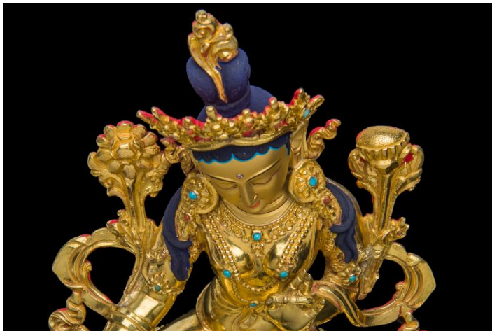
Bildunterschrift: Figur der Grünen Tara (Schutzpatronin Tibets)

Kontakt Übersee-Museum Bremen Julia Ditsch & Vanessa Roofing presse@uebersee-museum.de Bahnhofplatz 13 0421 160 38 104 /105 28195 Bremen www.uebersee-museum.de