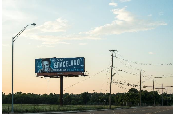
Near Memphis, 2016