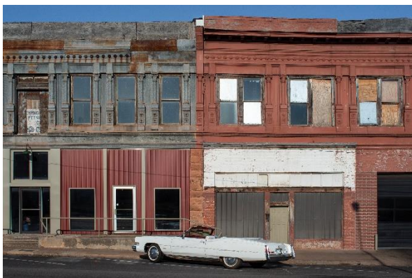
Chandler Oklahoma, 2018