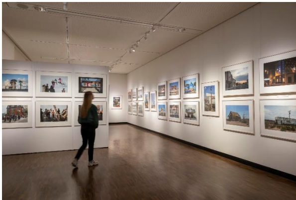
Ausstellungsansicht „American Dreams – Bilder aus den USA“, 2023, Foto Volker Beinhorn

T 0421 160 38 104/105 oder presse@uebersee-museum.de