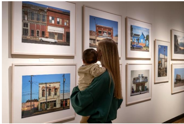
Ausstellungsansicht „American Dreams – Bilder aus den USA“, 2023, Foto Volker Beinhorn