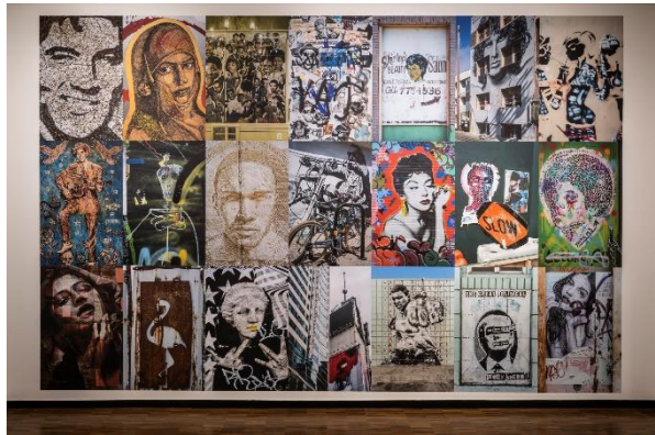
Ausstellungsansicht „American Dreams – Bilder aus den USA“, 2023