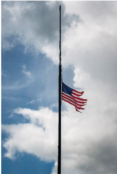
Flag near New Orleans, 2016