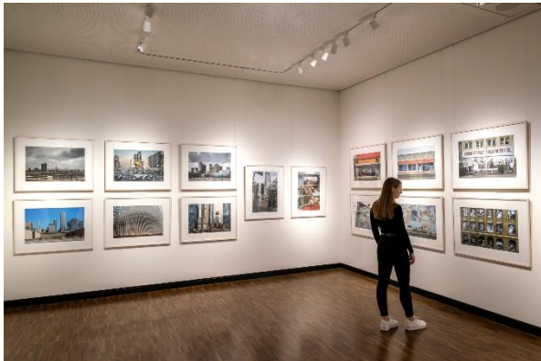
Ausstellungsansicht „American Dreams – Bilder aus den USA“, 2023