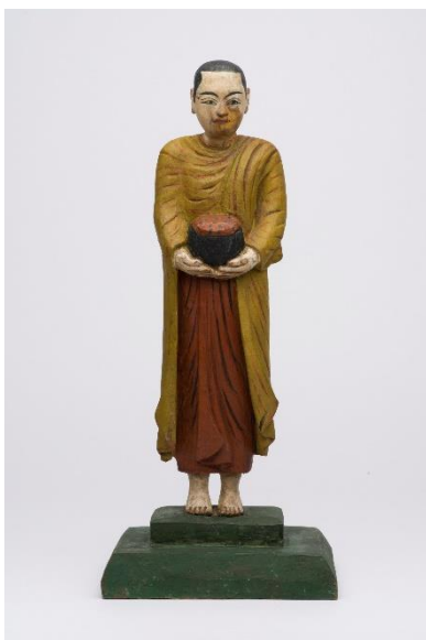
Mönchsfigur mit Bettelschale, Myanmar