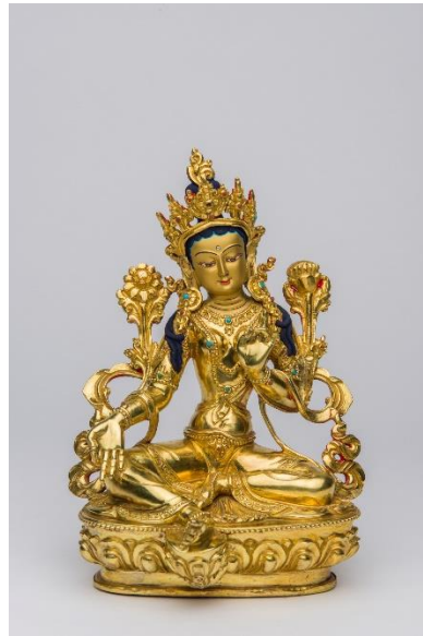
Grüne Tārā, Tibet, um 2010, Foto Volker Beinhorn © Übersee-Museum Bremen