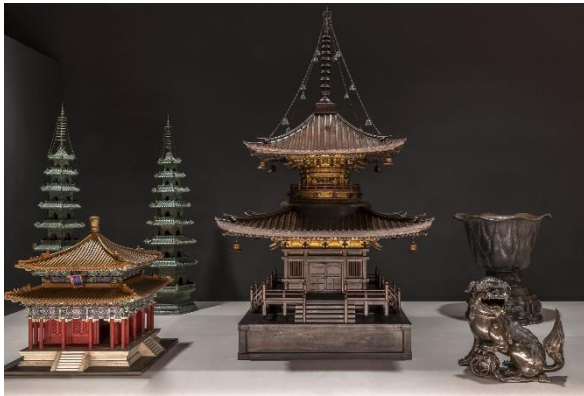
Ausstellungsansicht 5 „Buddhismus“, 2023, Foto Volker Beinhorn © Übersee-Museum Bremen