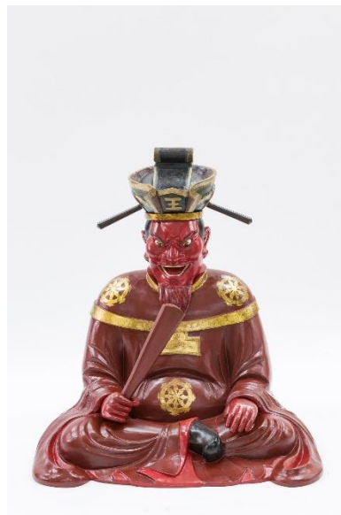
Der Höllenrichter Emma-ō, Japan, Foto Volker Beinhorn © Übersee-Museum Bremen