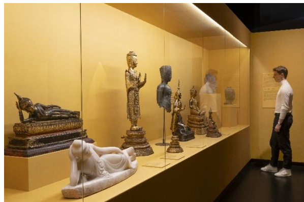
Ausstellungsansicht 4 „Buddhismus“, 2023, Foto Volker Beinhorn © Übersee-Museum Bremen