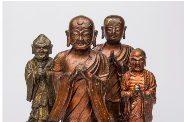
Figuren von Arhat-Schülern des Buddha, China, Bronze u. Stein, Foto Volker Beinhorn © Übersee-Museum Bremen