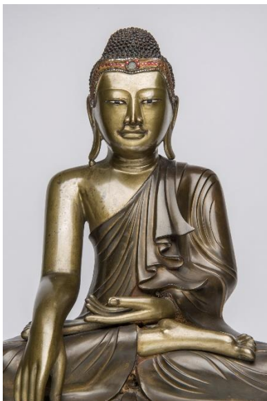
Buddha Śakyamuni, Myanmar, Bronze, 19. Jahrhundert