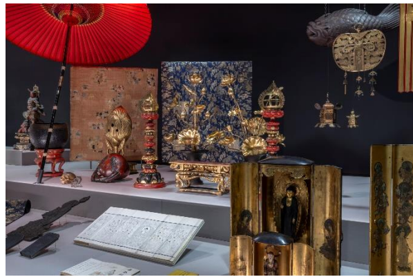
Ausstellungsansicht 2 „Buddhismus“, 2023, Foto Volker Beinhorn © Übersee-Museum Bremen