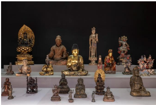
Ausstellungsansicht „Buddhismus“, 2023

T 0421 160 38 104 oder presse@uebersee-museum.de