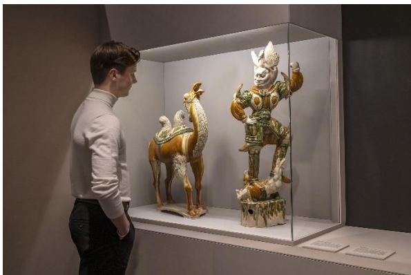
Ausstellungsansicht 3 „Buddhismus“, 2023