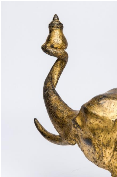
Elefant mit Opfergabe, Thailand, Bronze, Foto Volker Beinhorn © Übersee-Museum Bremen