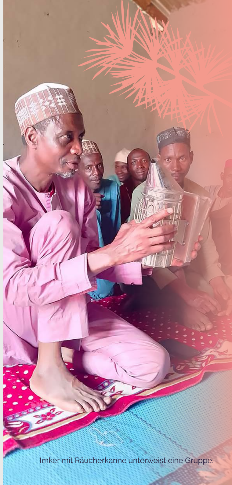
Imker mit Räucherkanne unterweist eine Gruppe.

Beide Geschichten – die des Raubes und die der Partnerschaft – erzählt die neue Ausstellung!